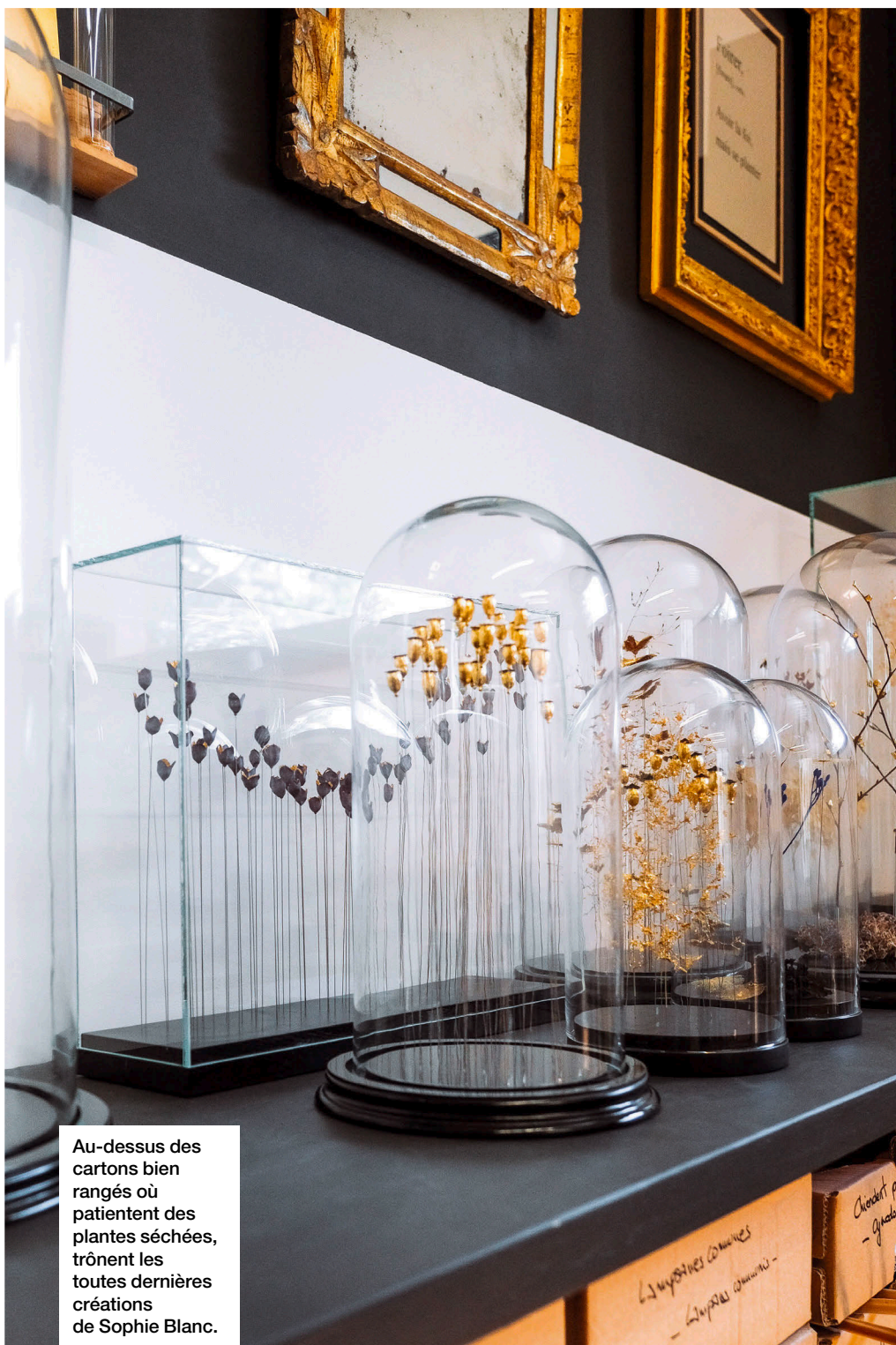
Au-dessus des cartons bien rangés où patientent des plantes séchées, trônent les toutes dernières créations de Sophie Blanc.